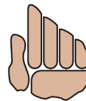
dale una mano