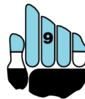
país de football