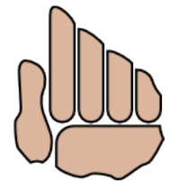
dale una mano