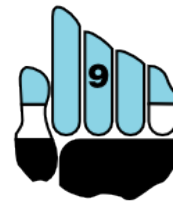
país de football