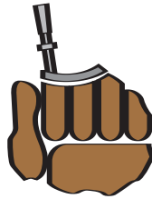
uruguay país espiritual