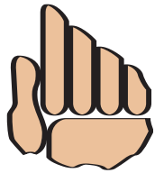
uruguay dale una mano