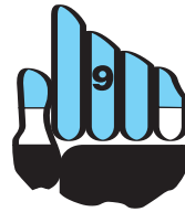
uruguay país de footb  ll