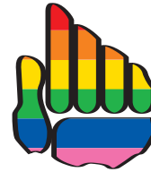
uruguay país consensual