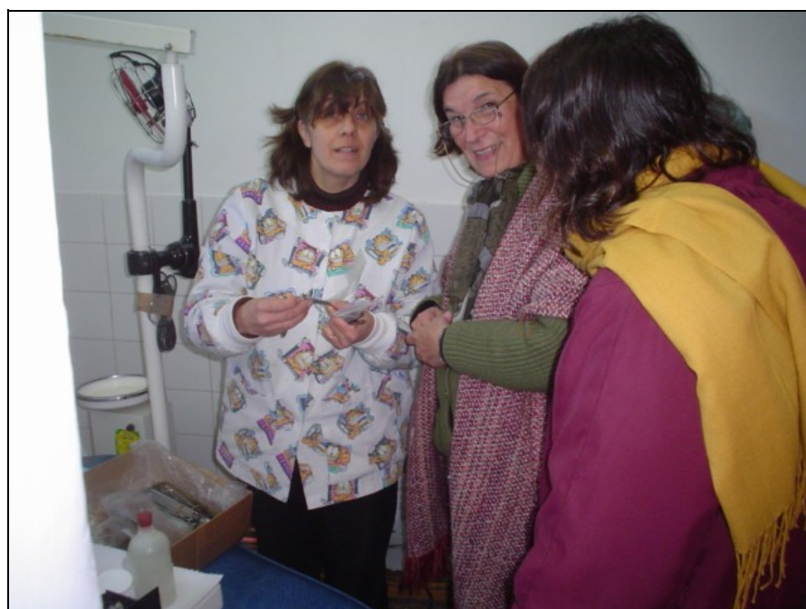
➔ Une odontologue, la présidente de la Comisión Fomento et un membre de Orilla 3 - Rive 3 de Montevideo