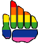
Uruguay país inclusivo