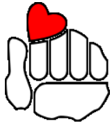
Uruguay país vital